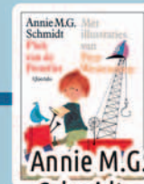
Annie M.G. Schmidt