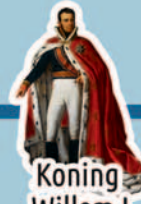
Koning Willem I