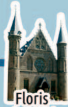
Floris de Vijfde