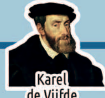
Karel de Vijfde