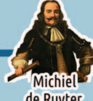
Michiel de Ruyter