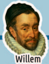
Willem van Oranje