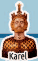
Karel de Grote