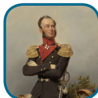
D: Willem II