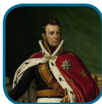
A: Willem I