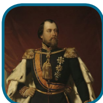
C: Willem III