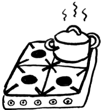
Een gasfornuis werkt op

Hieronder zie je vier tekeningen van dingen die allemaal energie verbruiken. Kun jij de zinnen onder de tekeningen afmaken?