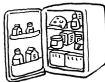
Een koelkast gebruikt