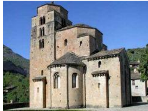
Santa Cruz de la Seros