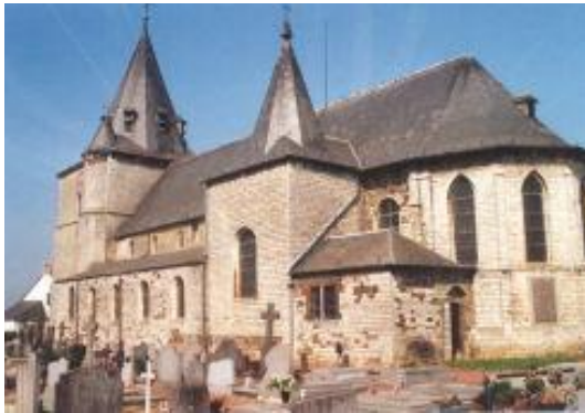
Tourinnes la Grosse